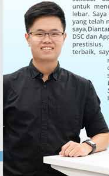
IMT Class of 2015