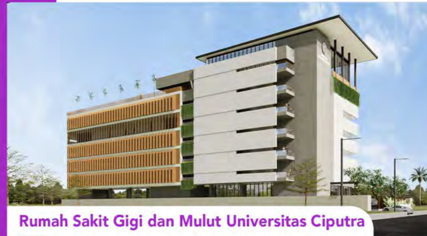
Rumah Sakit Gigi dan Mulut Universitas Ciputra